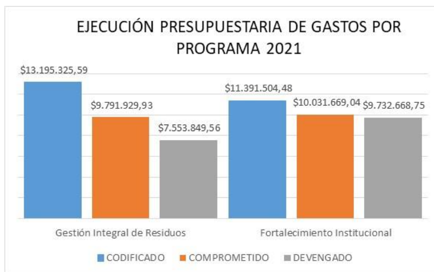
Grafico 2 Ejecución Presupuestaria de Gastos por Programa

Del cuadro que antecede se puede identificar que, del presupuesto de gastos al 31 de diciembre de 2021, se devengó el valor USD $17.286.518,31 que representa el 70,31% del presupuesto codificado.