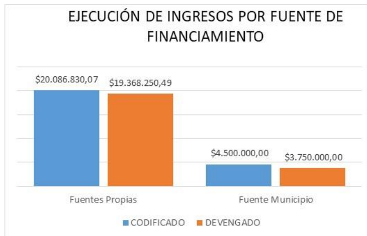
Grafico 1 Ejecución de Ingresos por Fuente de Financiamiento

Al 31 de diciembre de 2021, se registra un valor devengado de USD $23.118.250,49 en relación al codificado, con una ejecución del 94,03%.