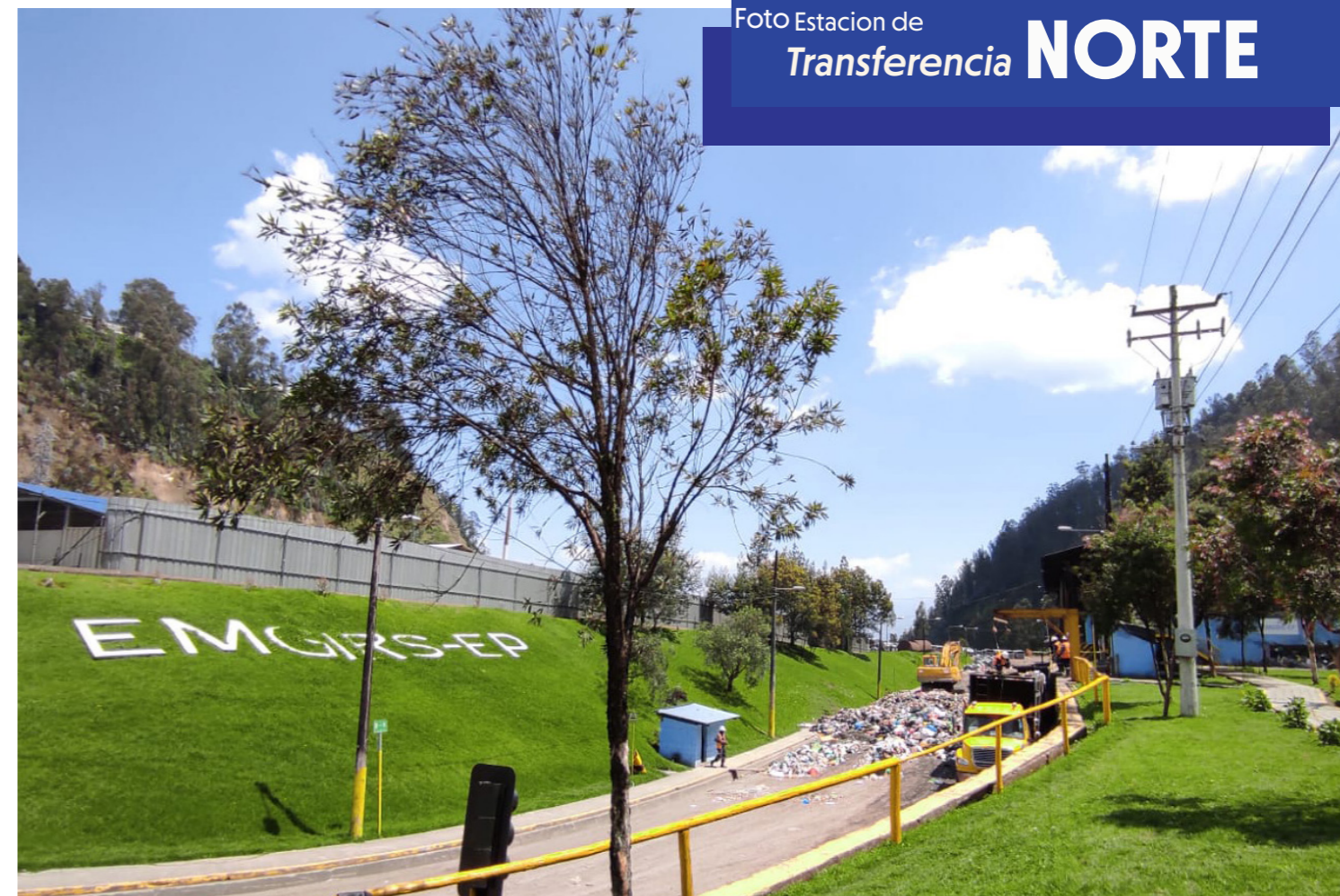
Foto Estacion de Transferencia NORTE

Las demás actividades operativas y de prestación de servicios relativas a las competencias que le corresponden al Municipio del Distrito Metropolitano de Quito, de conformidad con el ordenamiento jurídico nacional y metropolitano, en el ámbito del manejo integral de los residuos sólidos del Distrito Metropolitano de Quito.