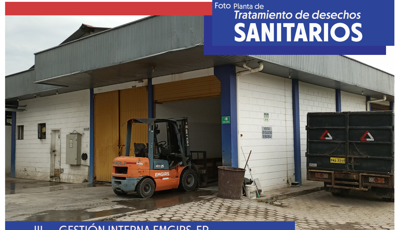
Foto Planta de Tratamiento de desechos SANITARIOS

Los clientes de las escombreras responden básicamente a 2 grandes fuerzas o grupos sociales y comerciales de la ciudad, el primero es el gremio de transportistas quienes llevan los escombros que produce la ciudad hasta las escombreras y el otro grupo es el de constructores del DMQ, quienes según las estadísticas de la EMGIRS EP, generan la mayor cantidad de ingresos por servicios preparados en la ciudad.