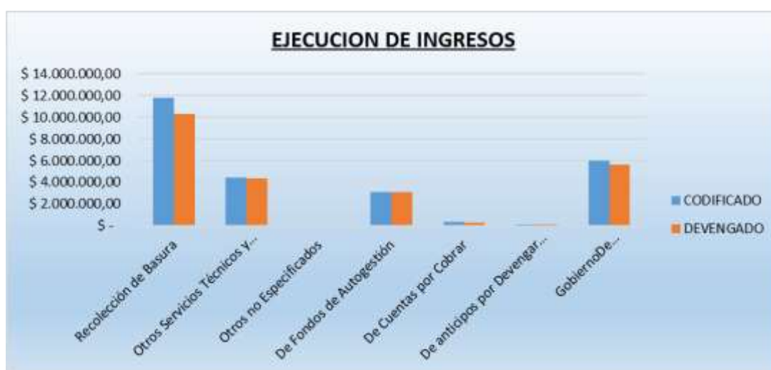
Grafico 2 Ejecución de Ingresos