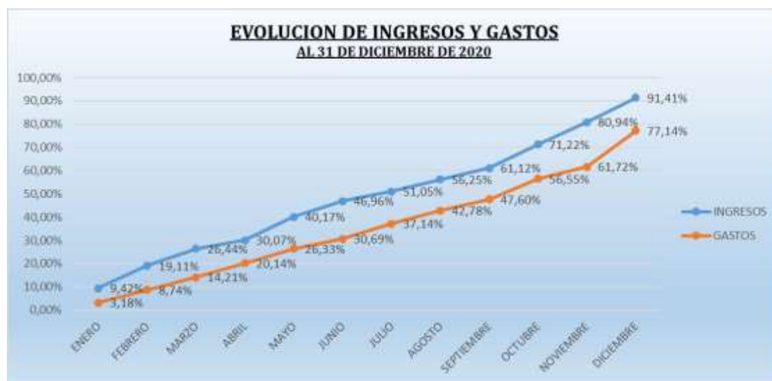
Grafico 6 Evolución de Ingresos y Gastos

Fuente: Sistema ERP. Elaborado por: Rosa Calahorrano