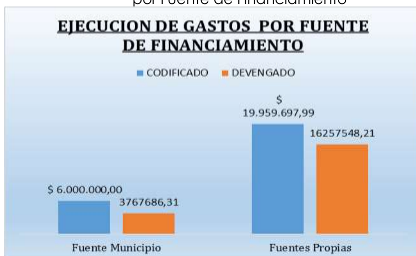
Grafico 5 Ejecución Presupuestaria de Gastos por Fuente de Financiamiento

Además, es pertinente indicar que los procesos que fueron adjudicados en el año 2020 y que por la necesidad institucional tienen un plazo superior al