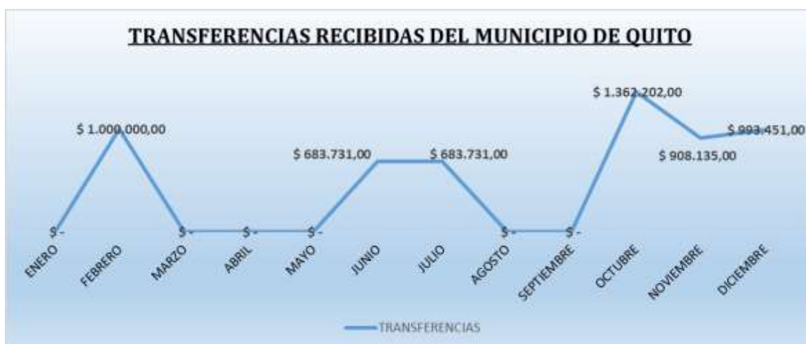
Grafico 3 Transferencias Recibidas