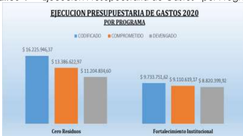
Grafico 4 Ejecución Presupuestaria de Gastos por Programa