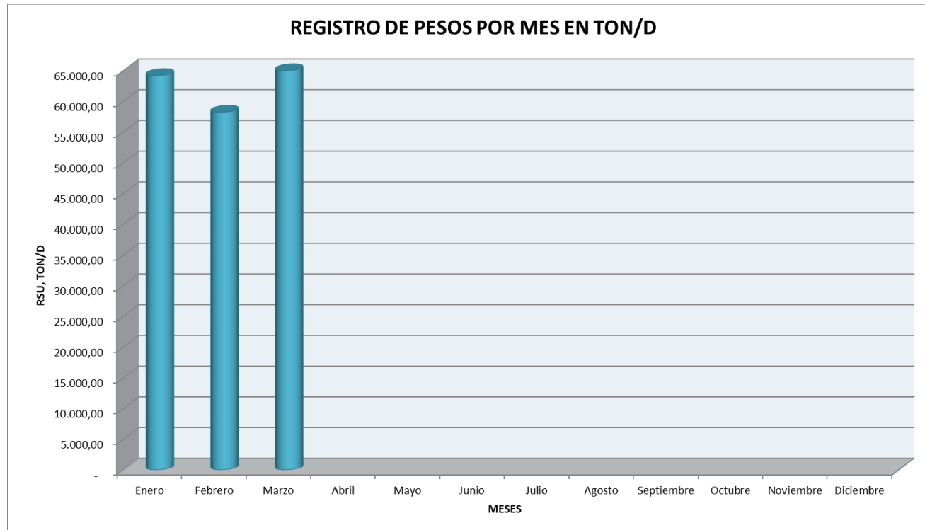
Gráfico 1: Registro de pesos por mes